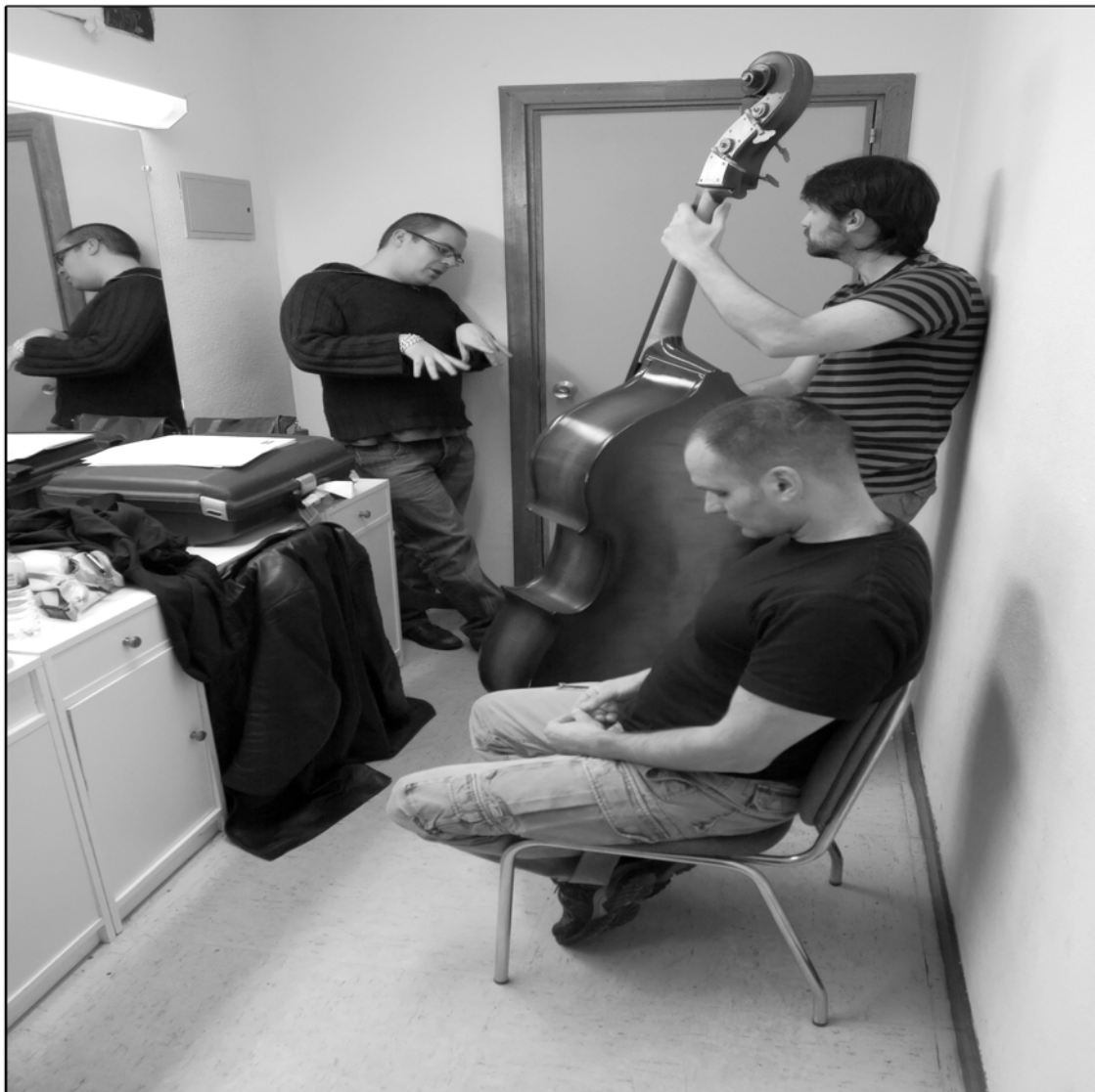
ABE RÁBADE TRIO · Fotografía de Sergio Calbanillas, Madrid, 2008.

Ofrece concertos no ámbito estatal e internacional, destacando os principais Festivais do estado español, así como concertos en París e Toulouse (Francia), Berlín, Munich e Kiel (Alemaña), Lausanne (Suíza), Porto, Lisboa e Madeira (Portugal), Tánxer (Marrocos), Boston (USA), Birmingham (UK), La Habana (Cuba), Helsinki (Finlandia), Salvador de Bahía (Brasil), entre outros.